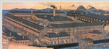
世界文化遺産「富岡製糸場」