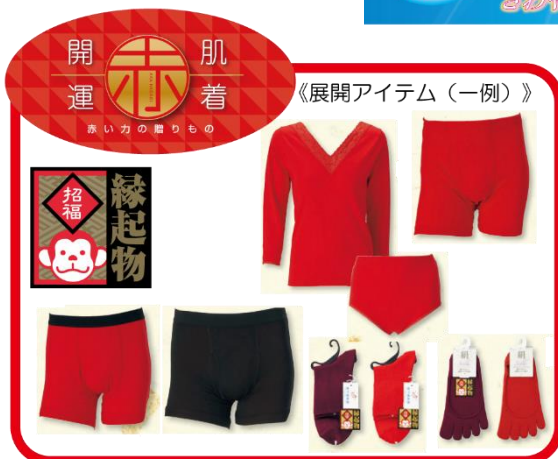
《展開アイテム(一例)》

※「COOL & DRY / クールアンドドライ」は、片倉工業(株)の登録商標です。(商標登録第4287178)