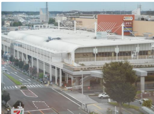
外壁のリニューアル