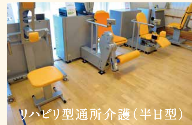
リハビリ型通所介護(半日型)