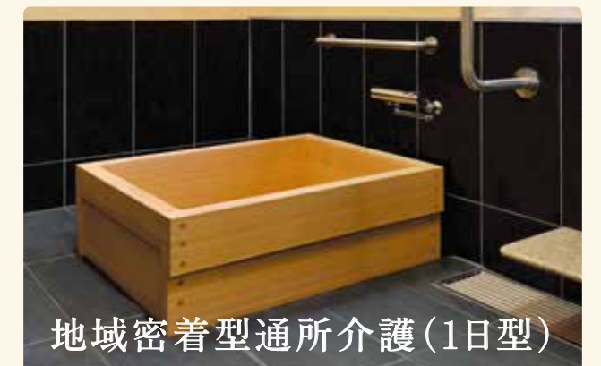
地域密着型通所介護(1日型)