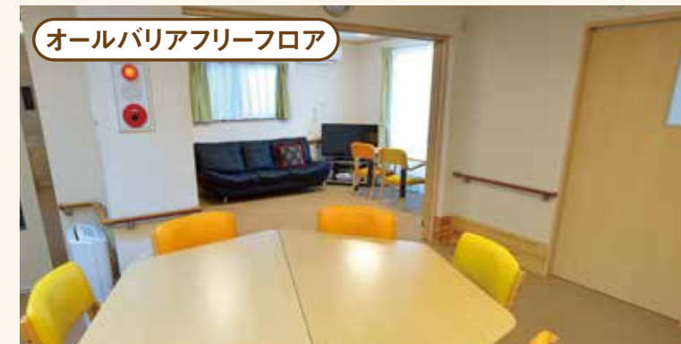
オールバリアフリーフロア

書道や貼り絵などの作品作りや、トランプや将棋など、ご利用者様のご希望を取り入れて実施いたします。