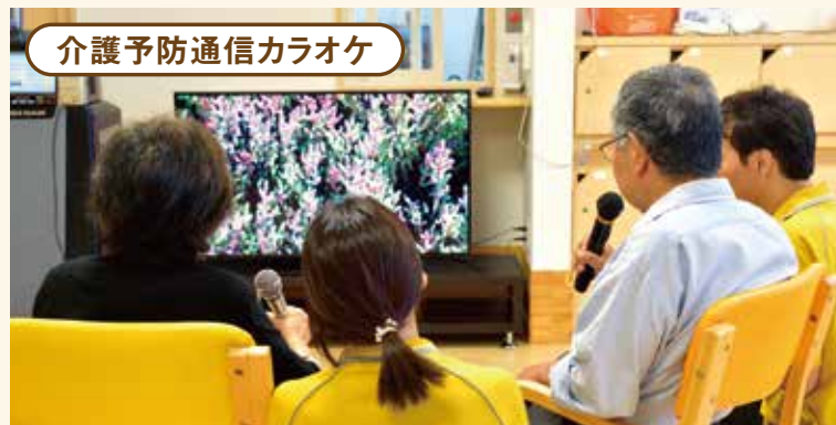
介護予防通信カラオケ