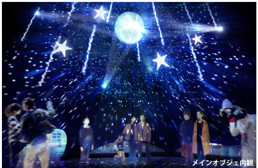
メインオブジェ内観