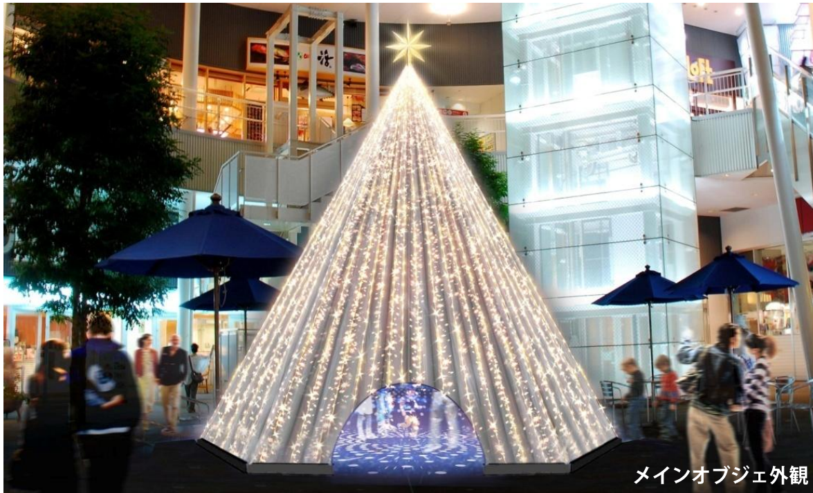
メインオブジェ外観