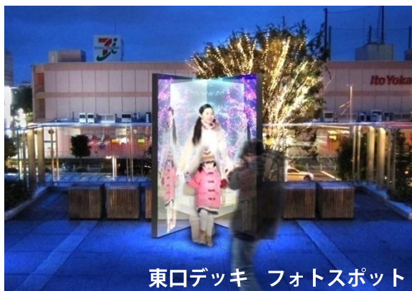
東口デッキ フォトスポット