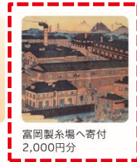
富岡製糸場へ寄付 2,000円分