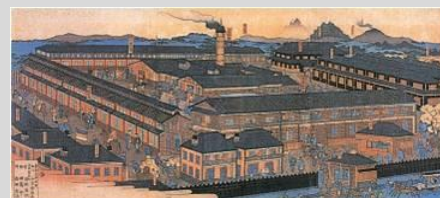
世界遺産「富岡製糸場」