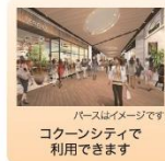
株主様御優待券 2,000円分