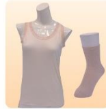
婦人肌着ノースリーブ M・L、 シルク混ソックス