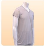
紳士肌着半袖V首 M・L・LL