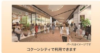
株主様御優待券 4,000円