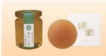
国産はちみつ180g、絹蜜洗顔石鹸