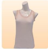
婦人肌着ノースリーブ M・L