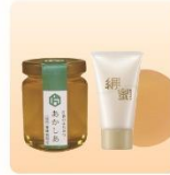
国産はちみつ180g、 「絹蜜」トライアルセット (洗顔石鹸+ジェル)