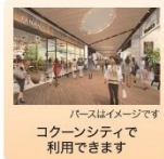
株主様御優待券 1,000円分