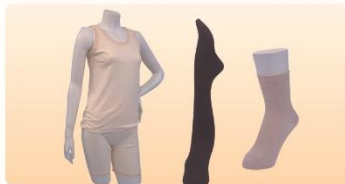
婦人肌着上下セット M・L、シルク混ソックス、 黒タイツ(80デニール)