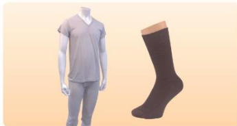
紳士肌着上下セット M・L・LL、シルク混ソックス