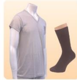
紳士肌着半袖V首 M・L・LL、 シルク混ソックス